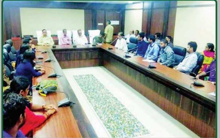
ତା. ୨୨.୧୧.୧୯ରେ ଶ୍ରୀମନ୍ଦିର ମୁଖ୍ୟ କାର୍ଯ୍ୟାଳୟ ଠାରେ ଓଡ଼ିଶା ଅର୍ଥ ସେବା (O.F.S.)ର ୨୩ ଜଣ ନବନିଯୁକ୍ତ ପ୍ରାପ୍ତ ଶିକ୍ଷାନବିଶିଷ୍ଟ କାର୍ଯ୍ୟାଳୟର ଉଚ୍ଚ ପଦାଧିକାରୀମାନଙ୍କ ଗହଣରେ ଆଲୋଚନାଚାରତ ।