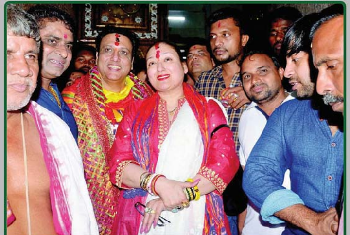
ତା. ୮.୧୨.୧୯ରେ ବଲିଉଡ଼ର ଖ୍ୟାତନାମା ଚଳଚ୍ଚିତ୍ର ନାୟକ ଗୋବିନ୍ଦା ସସ୍ତ୍ରୀଙ୍କ ସମ୍ପାଦକ ଶ୍ରୀମନ୍ଦିରରୁ ଶ୍ରୀବିଗ୍ରହମାନଙ୍କ ଦର୍ଶନ ସାରି ଫେରୁଛନ୍ତି ।