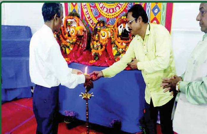
ତା. ୨.୧୨.୧୯ରେ ଭୁବନେଶ୍ୱରସ୍ଥିତ ପ୍ରଦର୍ଶନୀ ପଡ଼ିଆରେ ରାଜ୍ୟ ସରକାରଙ୍କ ଦ୍ୱାରା ଅନୁଷ୍ଠିତ ୨ୟ ପୁସ୍ତକ ମେଳାରେ 'ଶ୍ରୀମନ୍ଦିର ପ୍ରଶାସନ' ତରଫରୁ ପ୍ରଦର୍ଶିତ ଷଲ୍କୁ ଶ୍ରୀମନ୍ଦିର ପ୍ରଶାସକ (ନୀତି) ଶ୍ରୀଯୁକ୍ତ ଜିତେନ୍ଦ୍ର କୁମାର ସାହୁ ପ୍ରଦାପ ପ୍ରଞ୍ଜଳନ ପୂର୍ବକ ଉଦ୍ଘାଟନ କରୁଛନ୍ତି ।