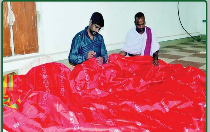
ତା. ୨୮.୧୧.୧୯ରେ ଶ୍ରୀମନ୍ଦିରରେ ମହାପ୍ରଭୁଙ୍କ 'ଓଡ଼ିଶା ଷଷ୍ଠୀ' ନୀତି ପାଇଁ ଶ୍ରୀମନ୍ଦିର କାର୍ଯ୍ୟାଳୟ ଠାରେ ଦରଜି ସେବକମାନେ 'ଘୋଡ଼ ଲାଗି' ପ୍ରସ୍ତୁତ କରୁଛନ୍ତି ।