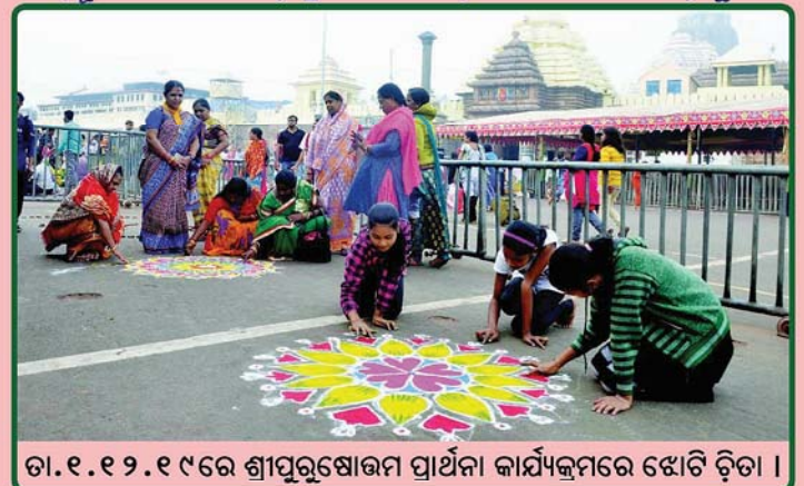
ତା. ୧.୧୨.୧୯ରେ ଶ୍ରୀପୁରୁଷୋତ୍ତମ ପ୍ରାର୍ଥନା କାର୍ଯ୍ୟକ୍ରମରେ ଝୋଟି ଚିତା ।

Printed & Published by Shree Jagannath Temple Administration, Puri, Ph. : 06752-222002, Fax - 252100